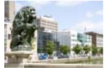
Rotterdam Kantoor Gemeente Rotterdam