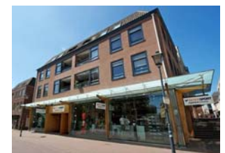
Arnhem Intersport winkel