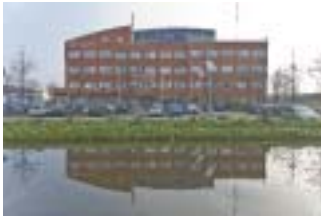
Den Haag Kantoor Omroep bedrijf