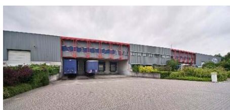
's-Heerenberg Logistiek centrum