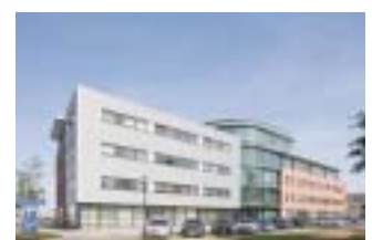
Veenendaal Multitenant kantoorgebouw