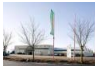
Oostburg Boerenbond Winkel